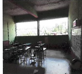
Foto 2: Se colocaran ventanas de PVC y vidrio para evitar que los animalitos entren y evitar agua y polvo.