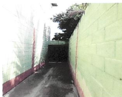
Foto 6: Seguimiento de muro en puerta de acceso ,para seguridad de la escuela.

Observación: Si es necesario se pueden agregar hojas adicionales y actualizar el número de hojas.