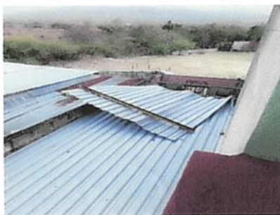
Foto 5: Elaboración de bodega encima de la terraza de la cocina por la falta de espacio.