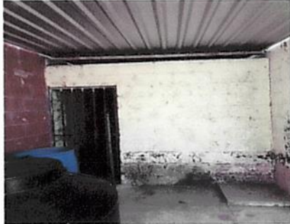
Foto 1: Se utilizara este espacio de la bodega para la construccion de la cocina ya que espacio no hay, y la cocina es una Prioridad.